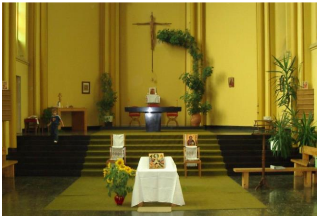
De kapel van het voormalige Latijns-Amerikaans College, in 2004 (boven) ook in 2011 (beneden).